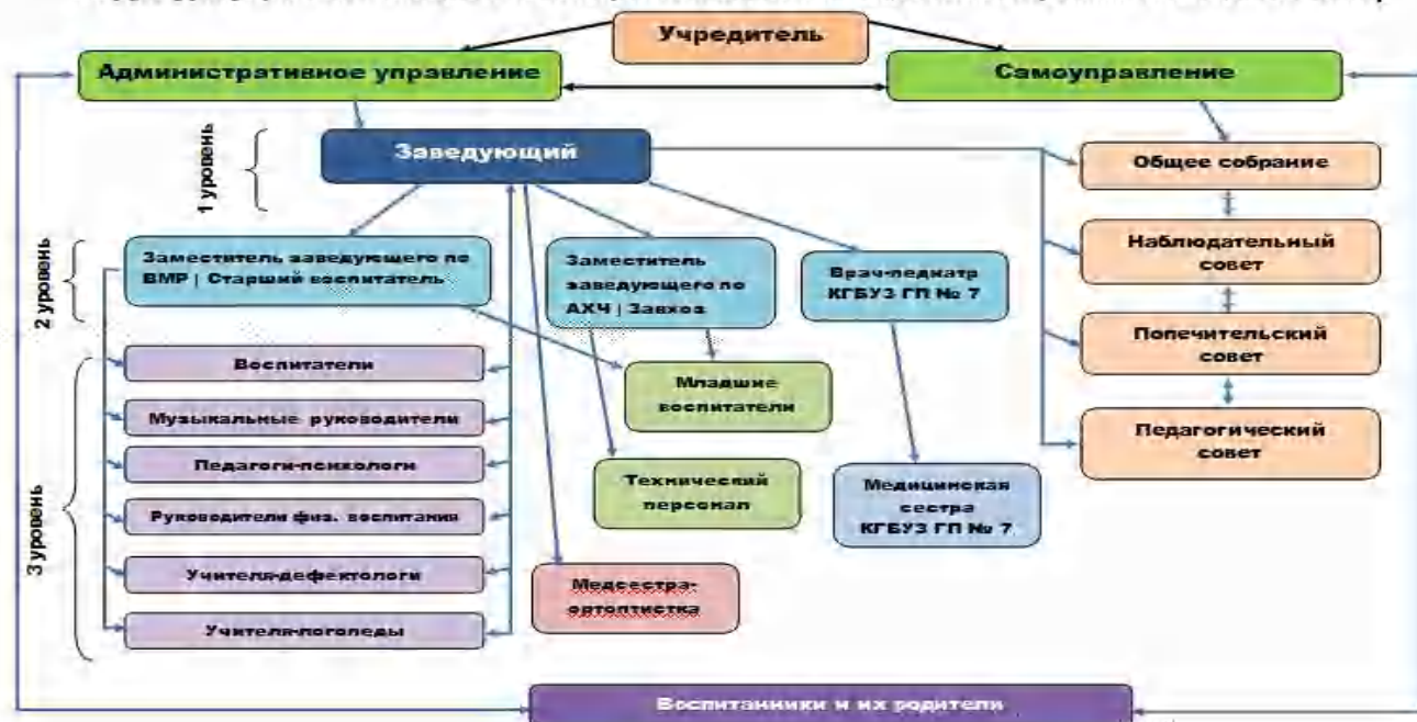
Структура управления МАДОУ г. Хабаровска «Детский сад комбинированного вида № 196»

Для полноценного функционирования и эффективного развития в ДОУ разработаны все необходимые локальные акты, ознакомиться с которыми может каждый желающий на сайте учреждения.